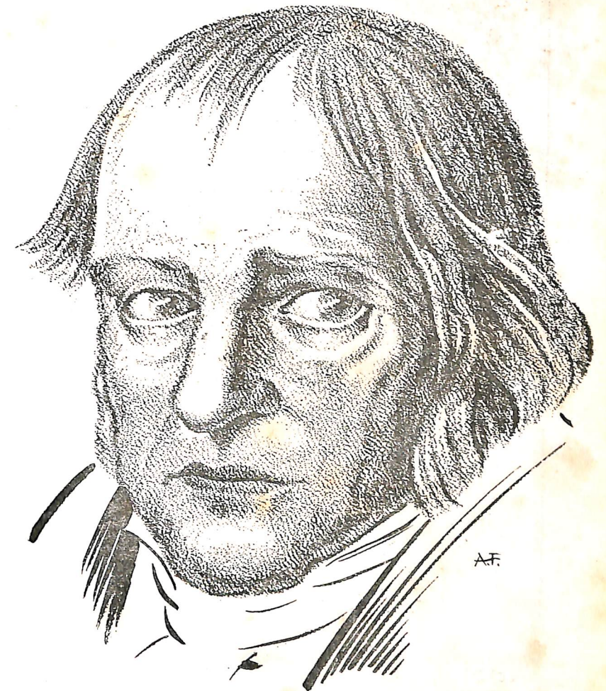
Jorge Guillermo Federico Hegel

Sabio filósofo idealista alemán, fué el creador del método dialéctico. En sus libros « Fenomenología del Espíritu » y « Ciencia de la Lógica » como en todo su pensamiento filosófico, hace entrever que los fenómenos históricos y morales de la humanidad son debidos a la Idea o al Espíritu Absoluto que dirige el mundo y el Universo. La filosofía palingenésica que postula el Espiritismo encuentra en Hegel sólidos argumentos filosóficos en su favor. Nació en Stuttgart en 1770; desencarnó en Berlín en 1855.