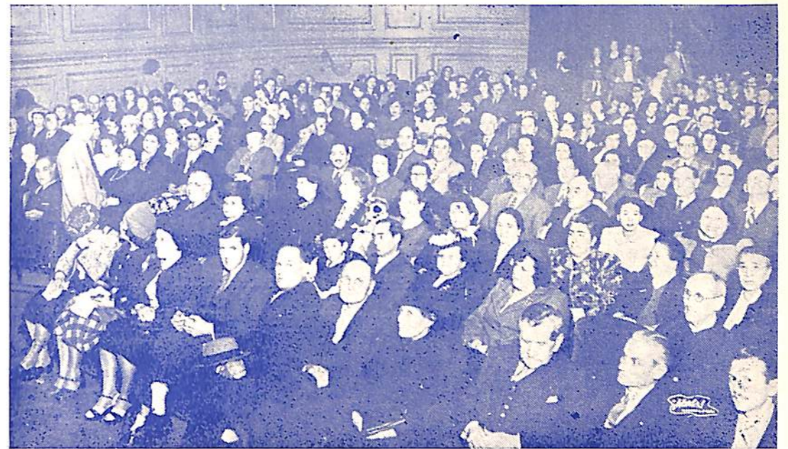
Una vista del Salón - Teatro "Lasalle" durante la fiesta.