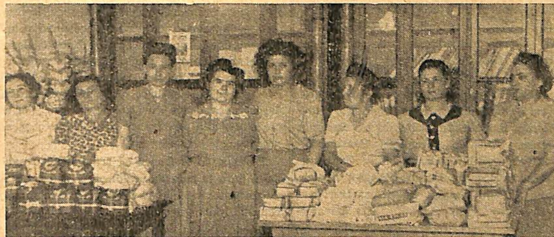
Primer reparto de ropas y víveres, realizado por la Agrupación Femenina Universal de Mar del Plata, en su Sede Social, Ingeniero Marcone 1345.

Francamente sentimos no reproducir el artículo citado que está redactado con toda mesura, y es un digno exponente de la preparación que caracteriza a dichos hermanos, y no dudamos que ha de constituir un ejemplo para los correligionarios de muchas instituciones del interior donde siempre que se trate de exponer los fundamentos de nuestra doctrina sin ataques ni agravios para nadie, han de hallar simpática acogida en la prensa y en el vecindario en que les toque actuar.