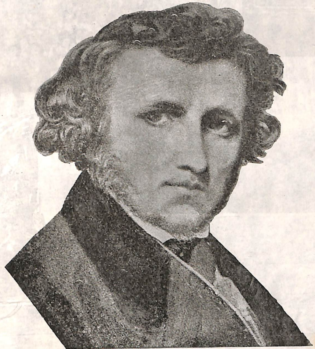
Reproducción de un grabado que muestra al maestro Allan Kardec, a la edad de 25 años. Figura poco conocida en las reproducciones efectuadas por las revistas espíritas.