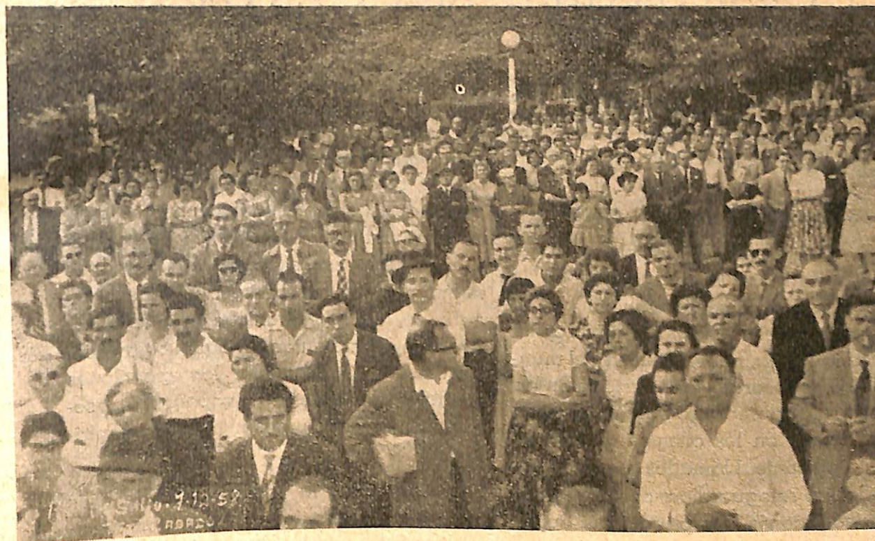
Vista parcial de la concurrencia en torno a la tribuna espiritista levantada en la Plaza de la ciudad.

lluvia de flores ofrecidas por manos cariñosas cubrió la tumba del maestro, como testimonio de la gratitud y reconocimiento que siempre le tributó su pueblo.