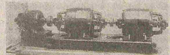
Grupo del motor y sus generadores.