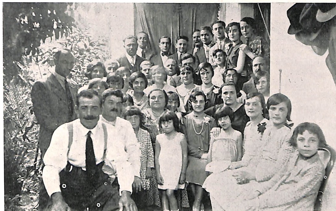
Parte del público, posando para «LA IDEA».

rado discurso puso de relieve las luchas y esperanzas de esa Sociedad, teniendo además frases de enaltecimiento para el Espiritismo, haciendo un llamado a la mayor fraternidad y armonía entre todos sus adeptos.