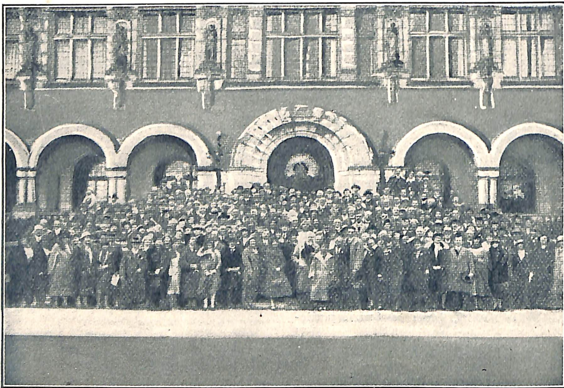
Congresistas reunidos sobre la gran escalinata del Palacio de la Paz