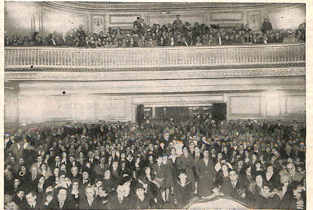
Vista de la concurrencia