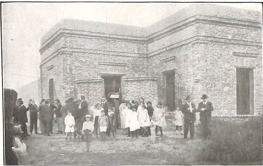
Frente del edificio social