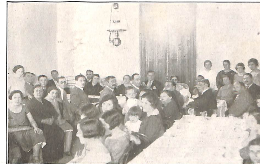
Cabecera de la mesa y parte de los asistentes al lunch de despedida