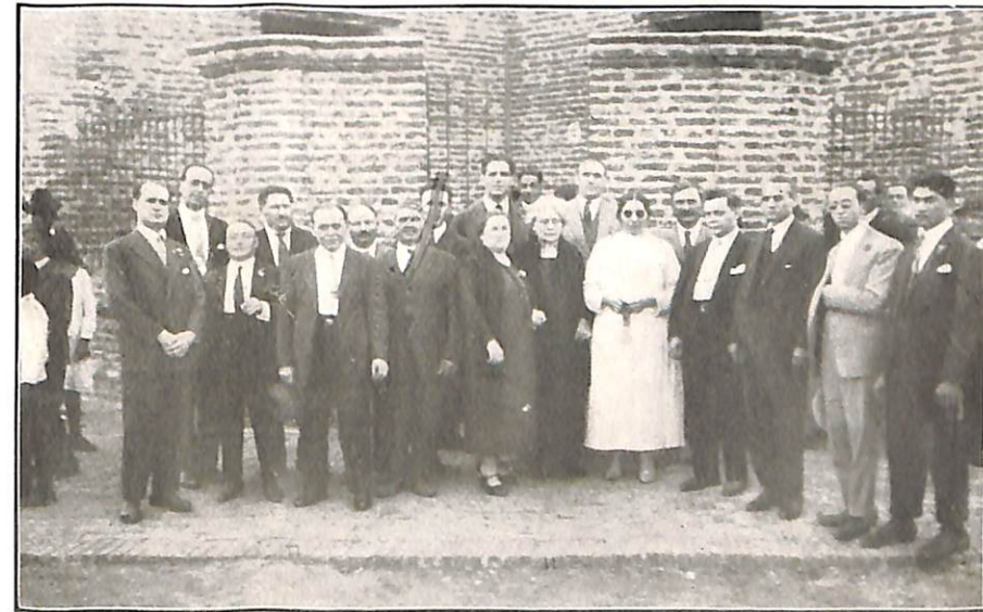
Delegaciones e invitados por la Sociedad