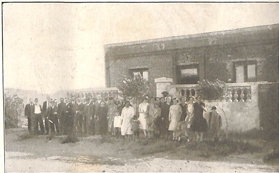
Local social propio