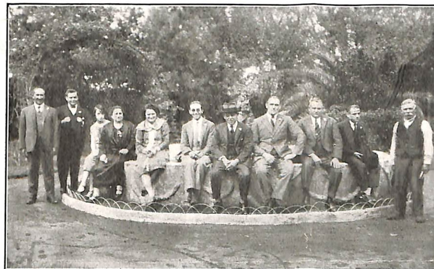
Visita al Parque de Pehuajó

que realizan aquellos correligionarios, modestos y voluntariosos que en lucha constante con los adversarios del Ideal Espiritista, saben mantener su credo y hacerlo respetar por los medios sencillos, pero eficaces, que se derivan de nuestra doctrina que son las prácticas del bien, del amor y la justicia.