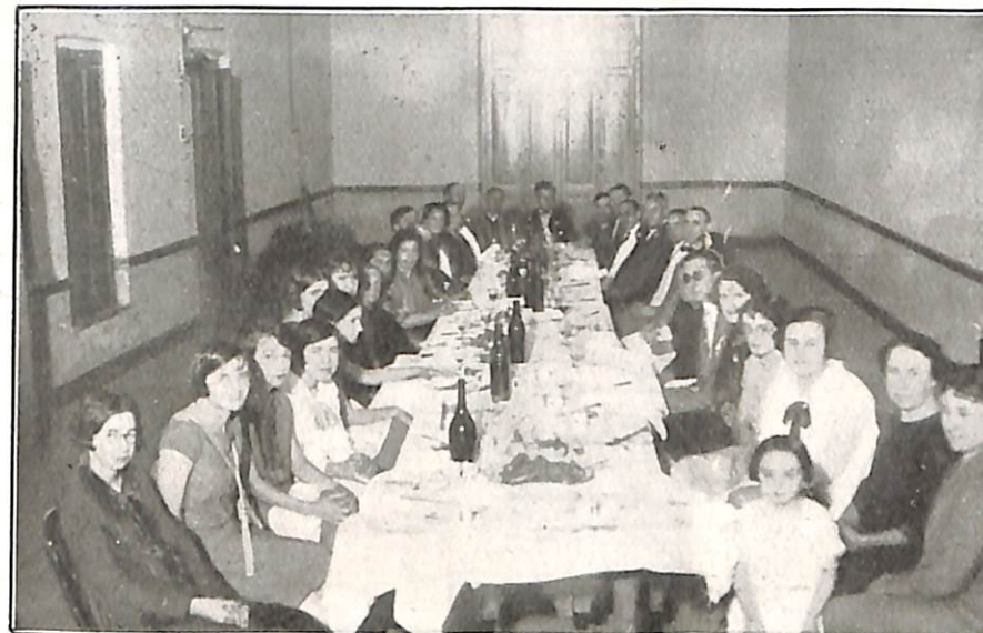
Cena dedicada a las delegaciones

La delegación de la Confederación Espiritista Argentina se complace en publicar las presentes notas gráficas de su jira, obtenidas por el fotógrafo correligionario señor Enrique González, delegado por la Sociedad “Hacia el Camino de la Perfección”, como una demostración de la gran obra