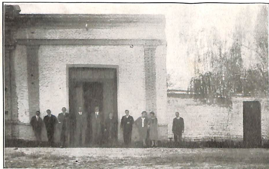
Frente del edificio

La delegación de la Confederación Espiritista Argentina se complace en publicar las presentes notas gráficas de su jira, obtenidas por el fotógrafo correligionario señor Enrique González, delegado por la Sociedad “Hacia el Camino de la Perfección”, como una demostración de la gran obra