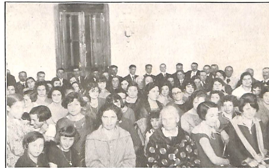
Parte de la concurrencia que asistió al acto inaugural

Los hermanos Pracilio viven para el Espiritismo y por el Espiritismo y todos sus actos se ajus-