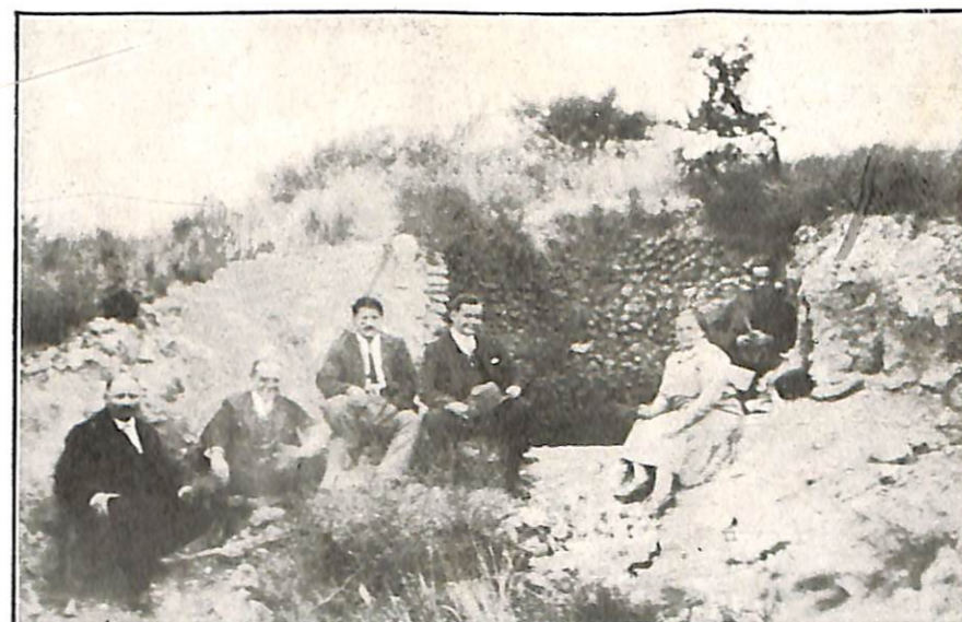
Recuerdo de la visita a las colinas de Santa Rosa

cos que el Espiritismo no es una secta, ya predicando con el ejemplo, forma sublime de desarmar a extraños; y por sobre todo, un concepto alto de moral y verdadera práctica.