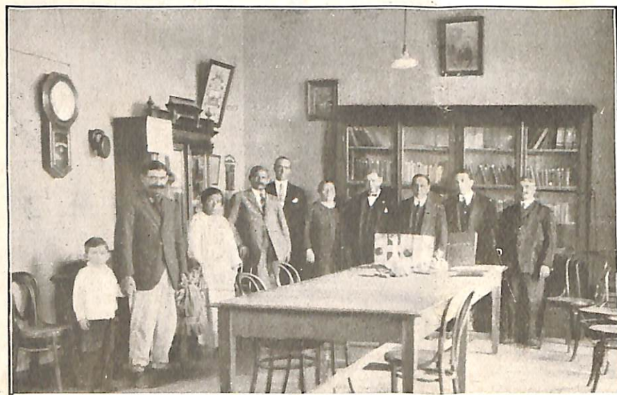
Biblioteca y parte del salón de actos