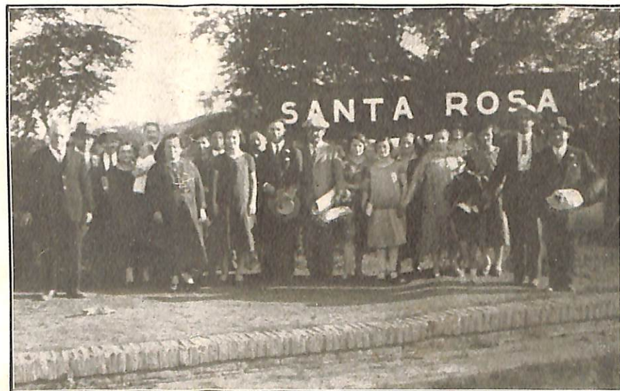
Rumbo a Buenos Aires

ARTES GRÁFICAS M. PALLÁS E. Unidos 1609 Bs. As.