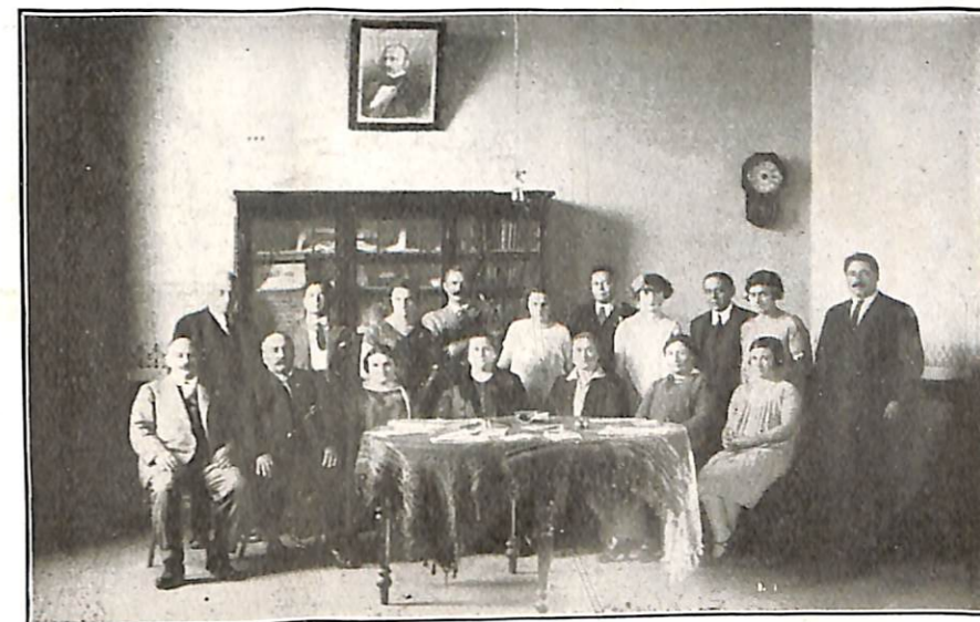
Salón de actos

Las enseñanzas recogidas son muchas y el provecho que de ellas emana se extiende de varias maneras; ya sea suavizando asperezas, y demostrando a fanáti-