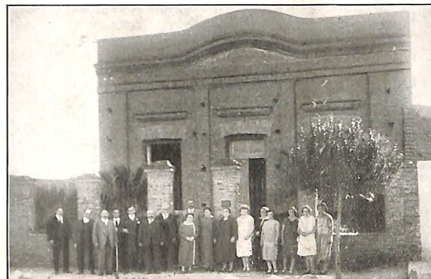
Local social propio

Han llegado a crear un periódico, «Fiat Lux», que cual indica su nombre, esparce como haz luminoso nuestro ideal y es tribuna que guía en aquellos apartados lugares a los que por razones económicas no pueden sostener una biblioteca.